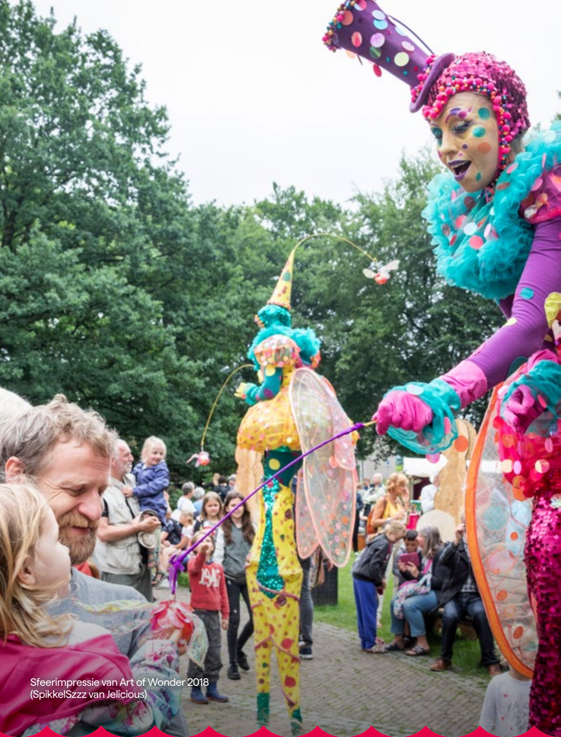
Sfeerimpressie van Art of Wonder 2018 (SpikkelSzzz van Jelicious)