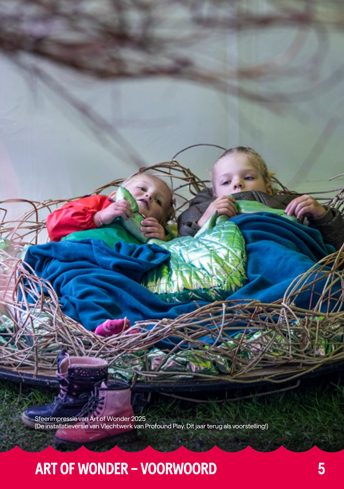
Sfeerimpressie van Art of Wonder 2025 (De installatieversie van Vlechtwerk van Profound Play. Dit jaar terug als voorstelling!)