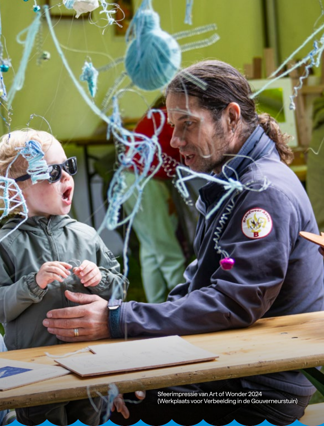
Sfeerimpressie van Art of Wonder 2024 (Werkplaats voor Verbeelding in de Gouverneurstuin)